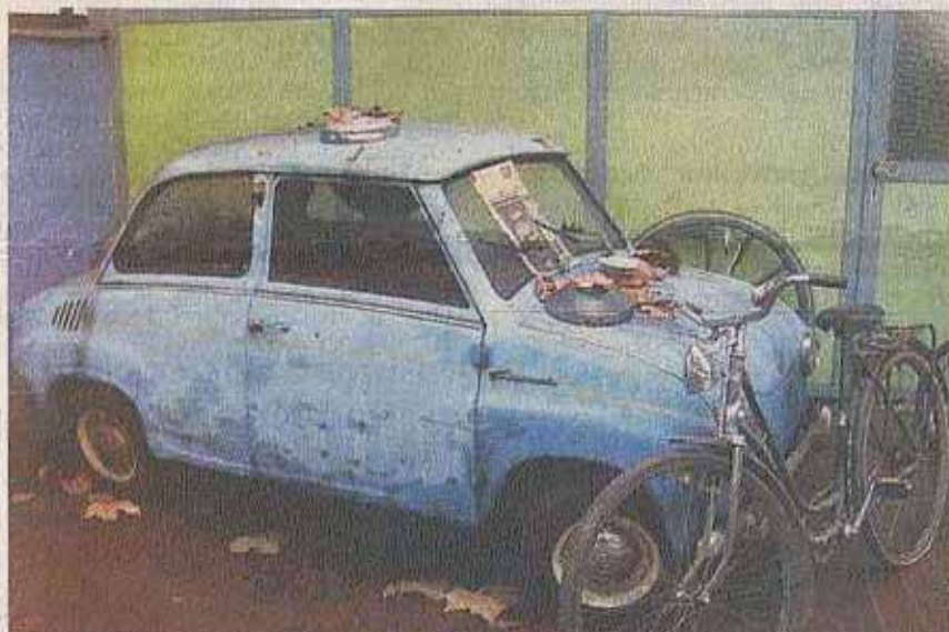
Liebevoll arrangiert steht das Goggomobil so im Museum, wie es oft auf Bauernhöfen zu finden war – irgendwo in der Ecke einer Scheune...