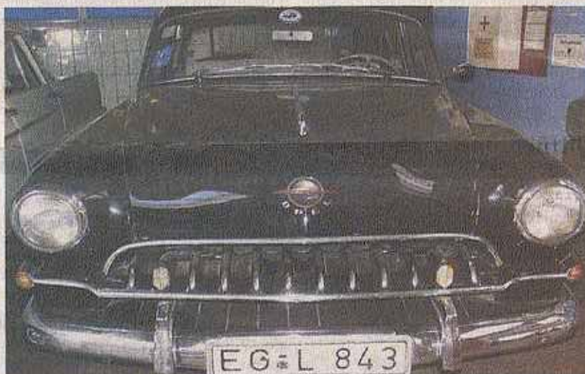
So etwas fuhr früher der Herr Generaldirektor: ein Opel Kapitän, hier noch mit dem inzwischen verschwundenen Kennzeichen des Altlandkreises Eggenfelden.